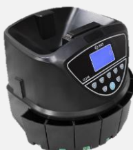
Contadoras de Monedas